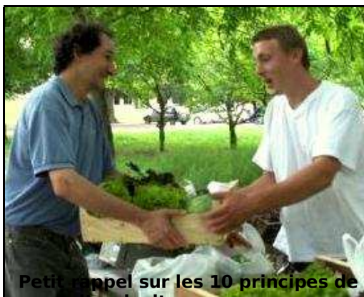
Petit rappel sur les 10 principes de l'agriculture paysanne

Nous vous invitons ainsi à nous contacter lorsque vous êtes en relation avec un nouveau producteur avant qu'il n'échange avec l'AMAP. Nous pouvons alors le rencontrer, discuter de ses pratiques et valider son accueil en toute transparence. Merci !